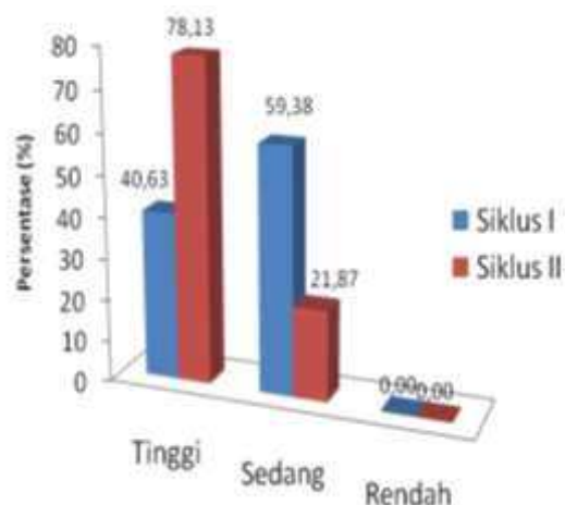
Gambar 1. Histogram Ketercapaian Target Minat Belajar

Data yang diperoleh dalam penelitian ini adalah proses dan hasil belajar. Proses belajar meliputi minat belajar dan rasa ingin tahu serta hasil belajar yaitu aspek kognitif. Dalam penelitian soal kognitif, angket minat belajar dan rasa ingin tahu diberikan pada setiap akhir siklus, yaitu pada akhir siklus I dan siklus II. Secara ringkas, data penelitian mengenai minat belajar peserta didik disajikan dalam Gambar 1.