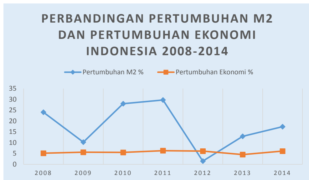
Gambar 1. Perbandingan Pertumbuhan Jumlah Uang Beredar (M2) dan Pertumbuhan Ekonomi Indonesia Tahun 2008 – 2014

Dari Gambar 1. pertumbuhan jumlah uang beredar pada tahun 2008, 2010, dan 2011 masing-masing adalah sebesar 24,05%, 27,98%, dan 29,69% sangat tinggi jika dibandingkan dengan pertumbuhan ekonomi sebesar 4 - 6%. Kelebihan likuiditas pada tahun 2008 menyebabkan inflasi pada tahun 2009 sebesar 17,11%. Sektor produksi menjadi terhambat dan pada tahun 2013 pertumbuhan ekonomi Indonesia sebesar 4,50% turun dari tahun 2012. Kondisi tersebut menunjukkan kinerja kebijakan moneter yang belum maksimal untuk itu perlu dilakukan kajian yang lebih mendalam mengenai faktor-faktor yang mempengaruhi permintaan uang di Indonesia.