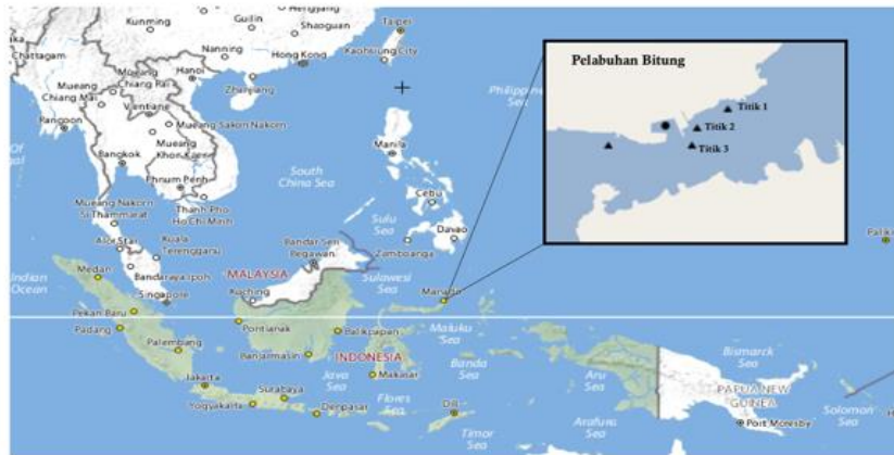
Gambar 1. Lokasi pengambilan sampel sedimen