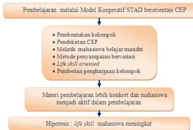
Gambar 1. Bagan Kerangka Berpikir Penelitian

Dosen memegang peranan penting dalam proses pembelajaran. Dosen diharapkan mampu menguasai dan mengembangkan materi yang dibutuhkan oleh mahasiswa. Dosen harus mengembangkan model pembelajaran guna membantu mahasiswa agar lebih memahami materi-materi pembelajaran. Bagan kerangka berpikir disajikan pada Gambar 1.