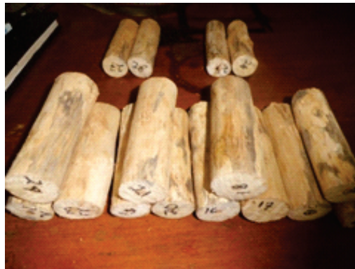
Gambar 1. Sampel kayu karet yang diawetkan menggunakan berbagai bahan pengawet Figure 1. Rubber wood samples were preserved by using various preservatives

kayu yang digunakan ditimbang dan diukur dimensinya menggunakan jangka sorong berupa diameter dan tinggi.