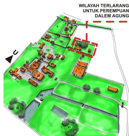
Gambar 1 Ruang Terlarang Untuk kaum Perempuan Di Dalem Agung

Di Kawasan Keraton Kasepuhan ada beberapa lokasi ruang yang dilarang untuk dimasuki kaum perempuan. Ruang tersebut adalah ruang Dalem Agung dan Ruang Makam Sunan Gunung Jati. ( lihat gambar 1 sampai gambar 3 ). Tindakan pelarangan untuk kaum perempuan berlaku hingga saat ini. Sepanjang sejarah belum pernah pelarangan ini dilanggar oleh pengunjung.