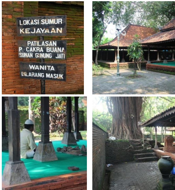
Gambar 2 Foto Ruang Terlarang Untuk kaum Perempuan Di Dalem Agung

tidak dibangun karena adanya dikotomi seperti dalam pemikiran kaum feminis. Keraton Kasepuhan dibangun berdasarkan landasan Agama Islam, dengan demikian pemikiran dikotomi itu tentunya tidak menjadi dasar karena pemikiran ini tumbuh sebelum adanya pembangunan Keraton Kasepuhan yang dibangun pada abad ke 13.