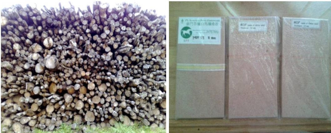
Gambar 3. Bahan baku dan produk MDF yang dihasilkan oleh salah satu pabrik pengolahan kayu karet di Sumatera Selatan Figure 3. Raw material and MDF product produced by one of rubberwood processing factories in South Sumatra