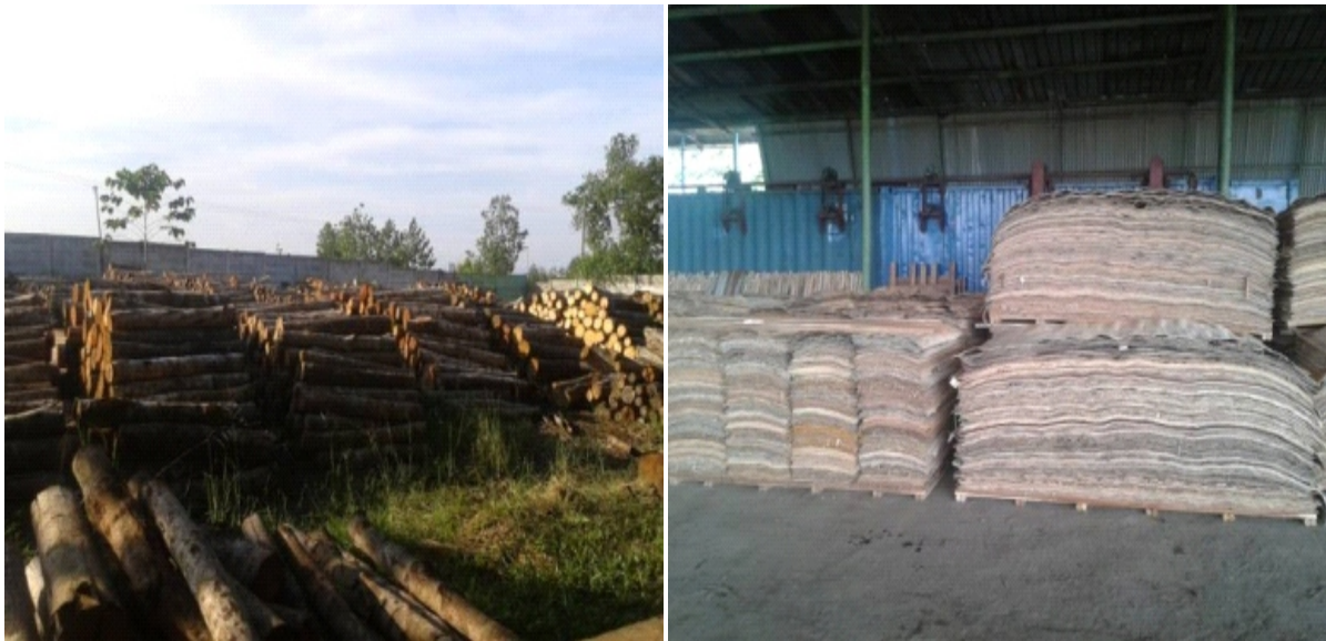
Gambar 1. Bahan baku dan produk veneer yang dihasilkan oleh salah satu pabrik pengolahan kayu karet di Sumatera Selatan Figure 1. Raw material and veneer product produced by one of rubberwood processing factories in South Sumatra

Kondisi bahan baku kayu karet yang dapat digunakan untuk pabrik batu bata ditampilkan pada Gambar 4.