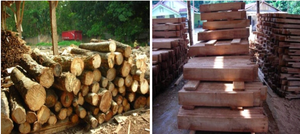
Gambar 2. Bahan baku dan produk kayu gergajian yang dihasilkan oleh salah satu pabrik pengolahan kayu karet di Sumatera Selatan Figure 2. Raw material and product of sawn timber produced by one of rubberwood processing factories in South Sumatra