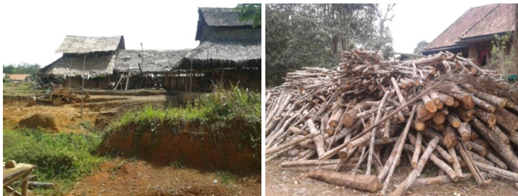
Gambar 4. Bahan baku kayu karet untuk pembuatan batu bata di Sumatera Selatan Figure 4. Raw material of rubberwood in brick production in South Sumatra