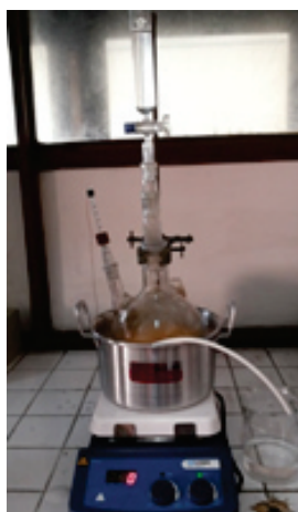
Gambar 1. Reaksi epoksidasi minyak jarak pagar Figure 1. Epoxidation reaction of jatropa curcas oil

berlangsungnya reaksi. Pengamatan yang dilakukan meliputi; terbentuknya gas, buih, peningkatan suhu yang terjadi serta perubahan warna yang tampak. Suhu reaksi dikontrol menggunakan termokopel.