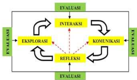
Gambar 1. Siklus Model Eksperiensial Jelajah Alam Sekitar (EJAS) (Sumber Alimah, 2013b: 8)

mereka melalui proses investigasi terhadap permasalahan yang ditemukan di lingkungan sekitar sebagai obyek belajar mereka ( learning to do ). Kegiatan merancang pembelajaran melalui pengamatan terhadap fenomena alam melatih mahasiswa untuk menggali, membangun, melatih, dan membiasakan kemampuan berpikir kritis mereka karena melalui permasalahan yang ditemui di lapangan mereka mampu menemukan dan mengkonstruksi konsep biologi yang mereka pelajari dari kegiatan eksplorasi lapangan ( learning to know ).