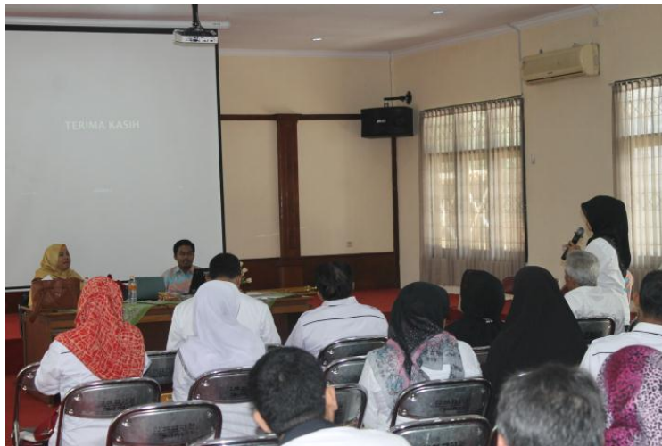
Gambar 3. Pelatihan PTK dengan Guru SD

Pelatihan adalah mengenai Outline, Abstrak, Metodologi Penelitian, penulisan pustaka, dan pengutipan.