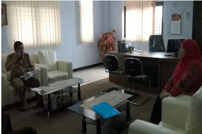
Gambar 2. Wawancara dengan Kepala Dinas P&K Kota Sukabumi