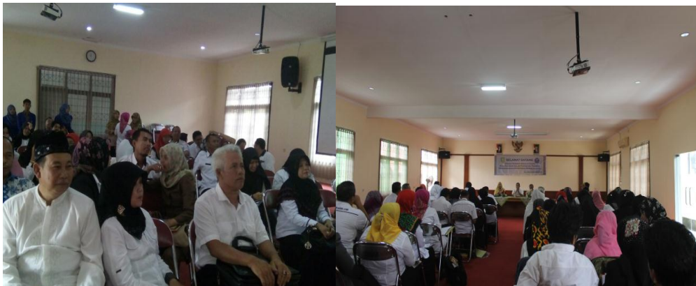
Gambar 3. Sosialisasi PKB dengan Guru SD

ketika diberikan pertanyaan mengenai PTK, guru mengalami kesulitan dalam pembuatannya, sehingga, peserta dan fasilitator menyimpulkan bahwa perlu diadakannya pelatihan dan pendampingan untuk pembuatan PTK. Selain itu juga, PTK dalam PKB adalah salah satu syarat dalam kenaikan pangkat guru.