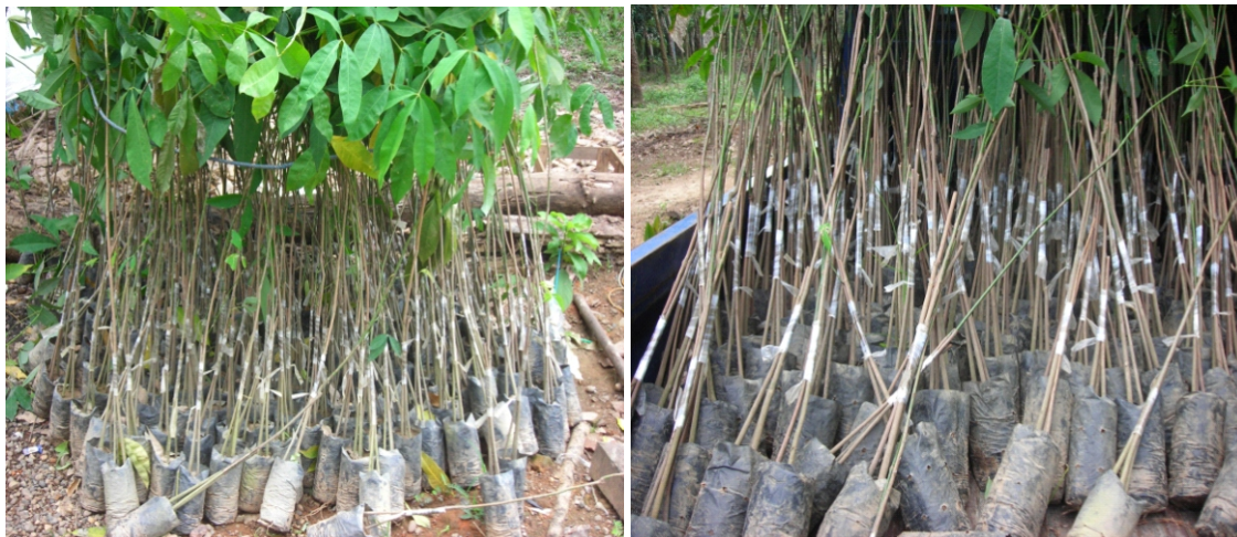
Gambar 3. Bahan tanam asal bibit kaki tiga yang tidak diokulasi Figure 3. Planting material of ungrafted three-in-one seed