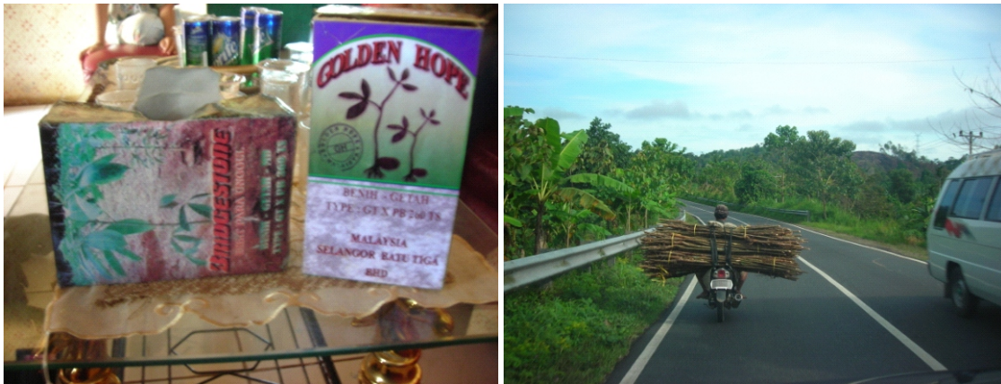
Gambar 2. Biji Golden Hope dan Brigestone (kiri) serta bahan tanam cabutan (kanan) Figure 2. Seeds called Golden Hope and “ Brigestone ” (left) and rubber seedling (right)