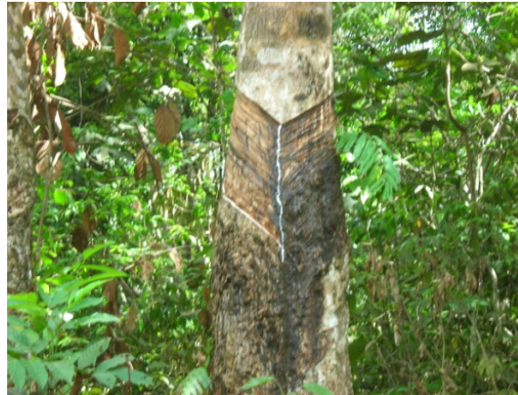
Gambar 4. Kondisi bidang sadap di kebun karet petani di Kabupaten Musi Rawas Figure 4. Tapping panel condition at smallholder rubber area in Musi Rawas Regency

diminati karena jumlah produksinya tinggi, dan paling banyak dijumpai di penangkar bibit.