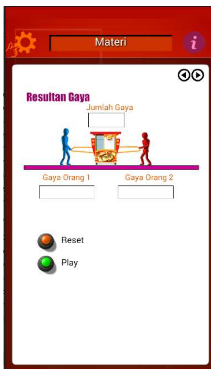
Gambar 4. Contoh tampilan inquiry dalam media

Hasil yang diperoleh dari ahli materi menunjukkan bahwa skor rata-rata multimedia yang dikembangkan secara keseluruhan adalah 82,50 (82,5% dari skor ideal). Berdasarkan perhitungan, multimedia berbasis mobile yang telah disusun menurut ahli materi memiliki skor 82,50 dengan kriteria baik (B). Data hasil validasi ahli materi disajikan oleh tabel berikut.