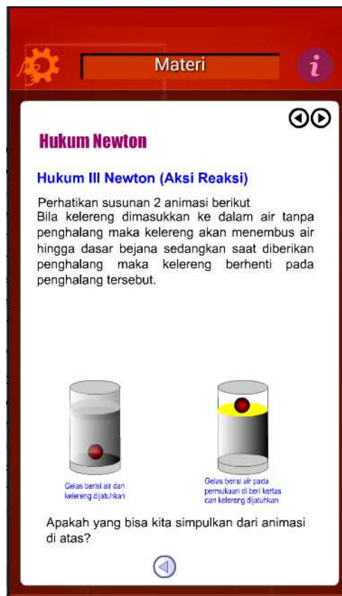
Gambar 3. Contoh tampilan pemodelan dalam media

Validasi produk multimedia yang dikembangkan melibatkan 4 orang ahli materi, 2 orang ahli media. Tujuan dari validasi adalah untuk mendapatkan penilaian dari ahli-ahli yang berkompeten dalam pengembangan multimedia, selain itu untuk mendapatkan masukan-masukan agar multimedia yang dikembangkan menjadi lebih baik. Adapun hasil revisi multimedia setelah di validasi, tampilannya diantaranya ada pada gambar 3 dan gambar 4.