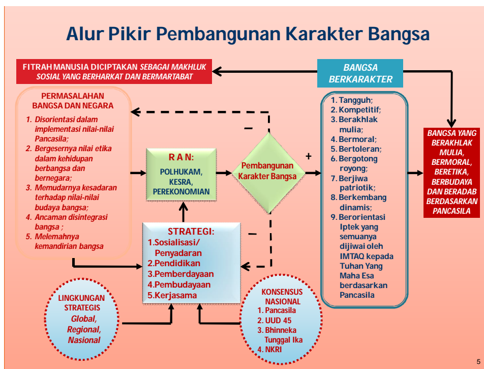
Gambar 2: Alur Pikir Pembangunan Karakter Bangsa Kemdikbud (2011)