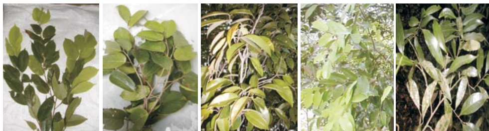
Gambar (Figure) 1. Foto daun/Leaf photo a) Cotylelobium melanoxyylon Pierre; b) Shorea balanocarpoides Symington; c) Cotylelobium lanceolatum Craib d) Cotylelobium melanoxyylon Pierre; e) Vatica perakensis King.

Analisa data dilakukan secara statistik untuk melihat perbedaan aktivitas inhibisi alfa glukosidase pada tiga jenis raru dengan dua macam metode ekstraksi (maserasi dan refluks). Pengolahan data digunakan dengan bantuan MINITAB 14.