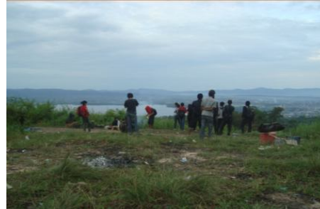
Gambar 2. Kondisi Arena Perkemahan/ Camping Ground Picture 2. Conditions Camping Ground