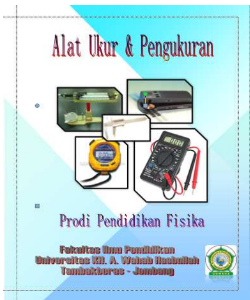
Gambar 1. Halaman muka bahan ajar