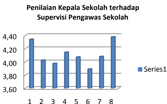
Gambar 1. Grafik Rata-rata penilaian kepala sekolah tentang supervisi yang dilakukan oleh pengawas sekolah

Penilaian terendah pada dimensi 2,3, dan 6. Item nomor 2 tentang kompetensi pengawas sekolah dalam melakukan pembimbingan pada tiap mata pelajaran dari rumpun mata pelajaran yang relevan. Item nomor 3 tentang kompetensi pengawas sekolah berkenaan dengan tugasnya untuk membimbing guru dalam menyusun silabus tiap mata pelajaran berdasarkan pengembangan KTSP. Item nomor 6 tentang kompetensi pengawas untuk melakukan pembimbingan dalam melaksanakan kegiatan pembelajaran/bimbingan (di kelas, laboratorium, dan atau di lapangan) untuk tiap mata pelajaran dalam rumpun mata pelajaran yang relevan.