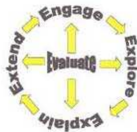
Gambar 1. Bagan ALur Pembelajaran Siklus ( Learning Cycle ) Tipe 5E

Model learning cycle pertama kali dikembangkan oleh Robert Karplus dari Universitas California, Barkley tahun 1970-an. Karplus mengidentifikasi adanya tiga fase yang digunakan dalam model pembelajaran ini yaitu preliminary exploration , invention , dan discovery . Berkaitan dengan tiga fase dalam learning cycle , Charles Barman dan Marvin Tolman menggunakan istilah exploration , concept introduction , dan concept application . Walaupun disebutkan dengan istilah yang berbeda, namun pada dasarnya mempunyai makna yang sama. Bahkan, model siklus belajar yang terdiri dari tiga fase tersebut selanjutnya dikembangkan dan diperinci kembali sehingga muncullah model learning cycle lima fase (5E) yang meliputi: engagement, exploration, explanation, elaboration/extension, dan evaluation. Berikut adalah bagan siklus belajar dan penjelasan ringkas dari tiap siklus: