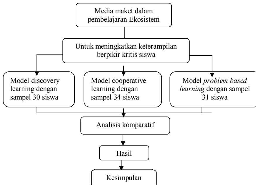
Gambar 1. Alur penelitian

Metode yang digunakan adalah kuasi eksperimental dengan desain kelompok pembandingan non-ekuivalen, yaitu kajian untuk menyelidiki hubungan antara suatu variabel terhadap variabel lainnya dengan mengkaji perbedaan peranan variabel bebas terhadap variabel tak bebas pada kelompok yang berbeda (McMillan dan Schumacher, 2001). Dalam hal ini dilakukan analisis terhadap pengaruh penggunaan media maket dalam tiga macam pembelajaran berbasis konstruktivisme ( model discovery learning , model cooperative learning , dan model problem based learning ) terhadap keterampilan berpikir kritis siswa. Untuk jelasnya, alur penelitian digambarkan sebagai berikut: