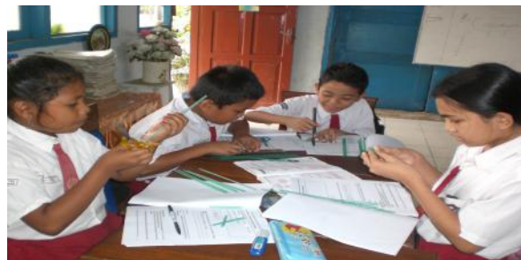
Siswa sedang mengerjakan aktivitas pada buku siswa dalam kelompoknya

Selanjutnya tahap field Test (Uji lapangan), perangkat pembelajaran pada prototipe ketiga sebagai prototipe akhir diujicobakan pada subjek penelitian yaitu siswa kelas V SD Negeri 179 Palembang sebanyak 21 siswa. Pada tahap aktivitas siswa diamati selama proses pembelajaran. Pada akhir pembelajaran diberikan tes yang meliputi seluruh materi geometri dan penukaran yang telah dipelajari sebelumnya. Hasil analisis observasi aktivitas dan hasil belajar siswa digunakan untuk melihat potential effect dari penggunaan perangkat pembelajaran yang dikembangkan.