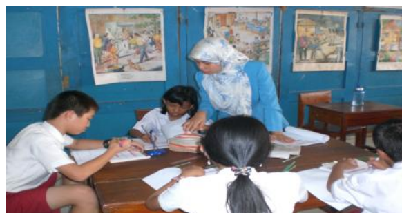
Interaksi antara peneliti sebagai guru dan siswa