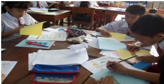
Siswa menggunakan model dalam menemukan suatu konsep matematika

Gambar 1 Beberapa aktivitas siswa saat proses pembelajaran di kelas uji coba.