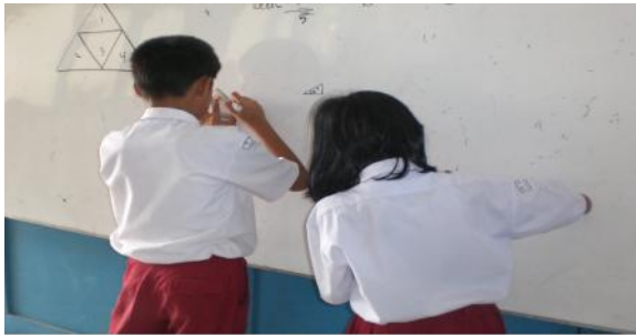
Siswa mewakili kelompoknya sedang mempresentasikan jawabannya dalam diskusi kelas