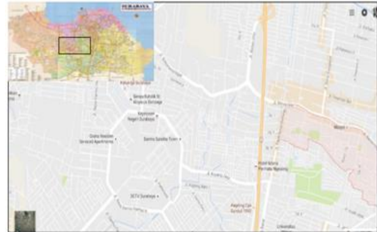
Gambar 1 Lokasi Studi

Batasan masalah yang diberikan ialah wilayah perencanaan sistem drainase meliputi saluran sekunder, debit air yang digunakan adalah debit limpasan air hujan (berdasarkan catchment area ) dan tidak memperhitungkan debit air buangan penduduk, mengevaluasi sistem drainase yang ada ditinjau dari fungsi dan kapasitasnya, tidak memperhitungkan sedimentasi pada saluran drainase, tidak memperhitungkan rencana anggaran biaya dari perencanaan drainase.