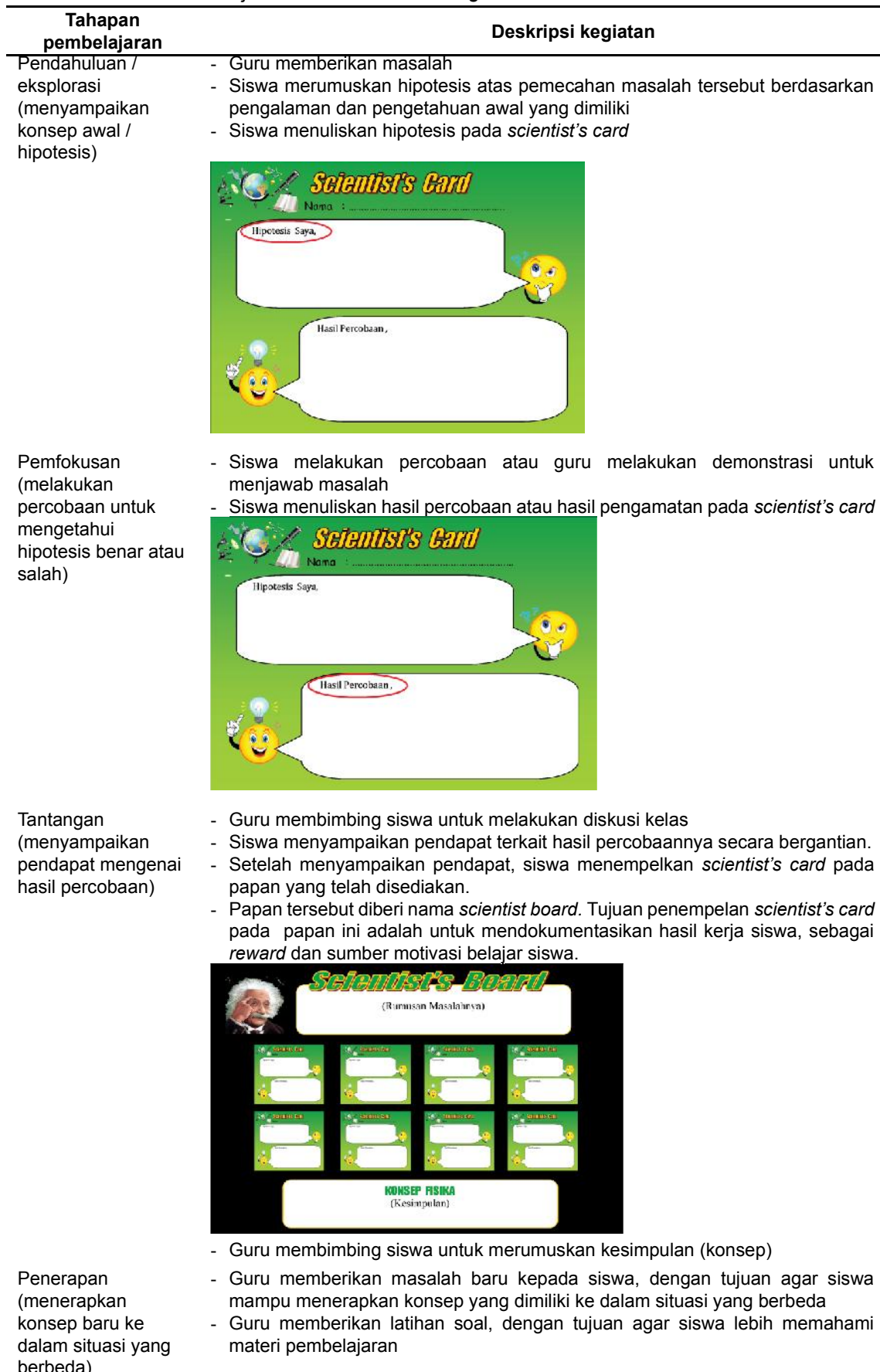
Tabel 2. Sintaks Pembelajaran Generative Learning Berbantuan Scientist's Card