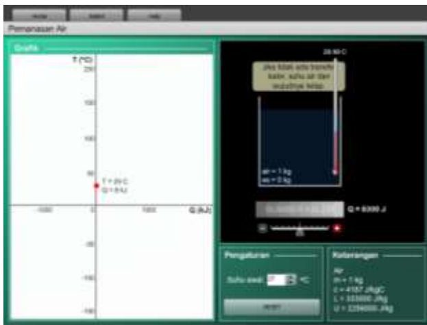
Gambar 2. Salah Satu Tampilan MPIK: Simulasi Pemanasan dan Pendinginan Air

Penelitian diawali dengan pengembangan MPIK, proses validasi, dan uji coba awal. Ini dilakukan agar multimedia yang dibuat sesuai dengan kriteria yang diharapkan. Setelah semuanya selesai, didapatkan produk MPIK yang siap digunakan di kelas. Berikut adalah tampilan MPIK pada materi pemanasan dan pendinginan air.