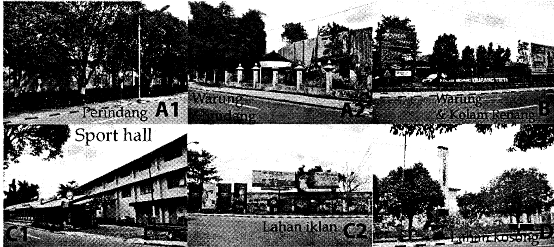
Keterangan: Kridosono dilihat dari sisi Selatan (A1 & A2); Barat (B); Utara (C1 & C2) dan Timur (D).

sono sebagai taman kota yang diasumsikan setara dengan utilitas u . Y adalah pendapatan. O ( offered ) adalah penawaran tambahan pajak. s adalah karakteristik sosial-ekonomi yang mempengaruhi preferensi individu. \epsilon_n adalah variabel acak yang didistribusikan secara independen dengan rerata nol. Perbedaan utilitas ( \Delta v ) yang terjadi dapat diekspresikan melalui persamaan (2).