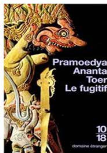
Gambar 2. Sampul buku Le Fugitif

Pertama, sampul buku asli dan buku terjemahan berbeda. Tidak ada penjelasan mengapa sampul kedua buku tersebut berbeda. Tapi mencoba untuk