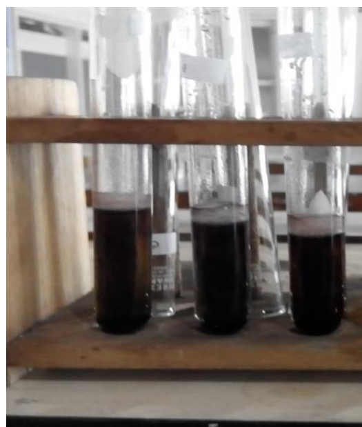
Gambar 1. Sampel yang Positif Mengandung Klorin (Berubah Warna Menjadi Biru)