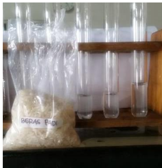
Gambar 1. Sampel yang Tidak Mengandung Klorin (Tidak Terjadi Perubahan Warna)

Laboratorium Putra Indonesia Malang dengan metode reaksi warna dan metode titrasi iodometri hasilnya tidak terjadi perubahan warna pada 19 sampel tersebut. Seperti yang terlihat pada Tabel 1 dan Gambar 1 dan Gambar 2.