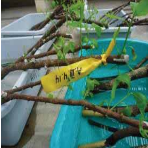
Gambar 1. Pertumbuhan tunas pada rendaman cabang cendana di rumah kaca

minggu kondisi terubusan sudah kuat, ukuran panjang tunas maksimal dan tidak layu, maka tunas tersebut sudah dapat dimanfaatkan sebagai sumber eksplan.