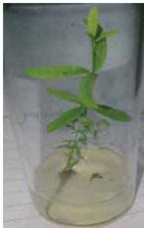
Gambar 4. Perakaran kultur jaringan Cendana menggunakan media \frac{1}{2} MS

Secara umum kondisi fisik yang diperlukan untuk menumbuhkan tunas cendana yang diakarkan adalah pada kisaran suhu 25°C – 27°C, kelembaban