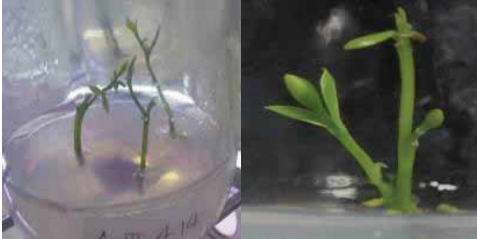
Gambar 2. Hasil induksi cendana sampai dengan minggu ke-4 dalam media MS

Keterangan : Nilai rata-rata dalam kolom yang diikuti huruf yang sama menunjukkan tidak ada perbedaan yang nyata pada taraf uji DMRT 5%