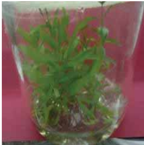
Gambar 3. Hasil multiplikasi pada kultur jaringan cendana pada umur 4 bulan setelah kultur

Hasil uji DMRT menunjukkan bahwa pertumbuhan panjang tunas terbaik pada multiplikasi cendana ditemukan pada klon A.III.4.14 sedangkan hasil terendah pada klon WS28. Perkembangan jumlah