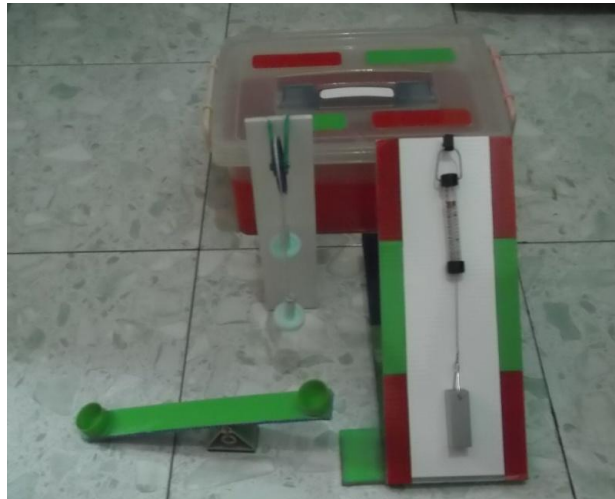
Gambar 1. Produk Akhir

Produk akhir Alat peraga pesawat sederhana ini dapat dilihat pada Gambar 1.