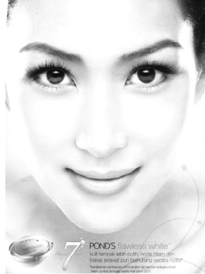
Gambar 4. Iklan Kosmetik Pemutih Kulit, Produksi Luar Negeri, Merk Pond's (Sumber: Majalah Femina , Edisi 20-26 Desember 2007, Halaman 31).

Gambar 3 dan 4 tersebut di atas adalah representasi iklan untuk kosmetik pemutih kulit yang diproduksi di dalam negeri, yakni merk Viva White (gambar 3) dan produk asing yang bermerk Pond's (gambar 4). Fenomena kulit putih, yang notabene khas Barat itu, kini dianggap sebagai standar ideal yang menghegemoni kesadaran bangsa-bangsa Timur, termasuk Indonesia sehingga menggeser mainstream wacana warna kulit bangsa Timur yang telah mengideologi ribuan tahun lamanya, yakni sebagai bangsa yang berkulit misalnya sawo matang, kuning langsung, coklat, kuning, atau hitam.