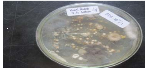
Gambar 1. Koloni kapang pada hari ke-7 pada pengenceran 10^{-1} . A. flavus (1) dan A. niger (2).

Secara makroskopis koloni kapang yang tumbuh terlihat berwarna hijau kekuningan yang merupakan indikator adanya A. flavus . Selain itu juga tumbuh A. niger yang berwarna kecoklatan hingga hitam seperti yang terlihat pada gambar di bawah ini.