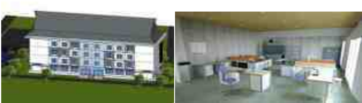
Gambar 3. Situasi Pencahayaan Alami

Penggunaan cahaya alami dilakukan secara optimal sehingga minimal 30% luas lantai yang digunakan untuk bekerja mendapatkan intensitas cahaya alami minimal sebesar 300 lux.