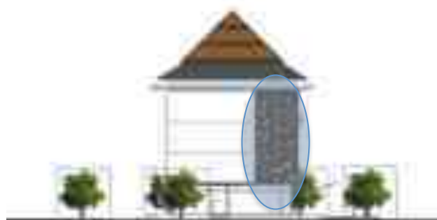
Gambar 4. Fasad Koridor

Tidak mengkondisikan memberi Air Conditioner (AC) pada tangga, koridor, dan toilet, serta melengkapi ruangan tersebut dengan ventilasi alami.