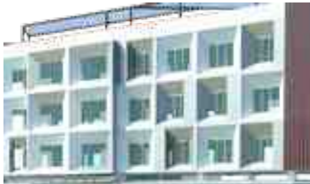
Gambar 8. Shading Device pada Bangunan

Menjaga kenyamanan visual dan kenyamanan thermal pada bangunan. Penambahan shading device pada fasad bangunan dilakukan untuk bukaan orientasi ke utara, karena bagian tersebut menerima banyak sinar matahari dari pagi hingga sore hari. Shading device yang direkomendasikan, yaitu dengan penghalang di bagian kanan dan kiri bukaan karena potensi panas dan silau terbesar berasal dari arah timur-barat bangunan.