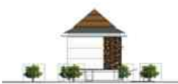
Gambar 2. Vegetasi Science Learning Center (Sumber : Dokumentasi pribadi, 2016)