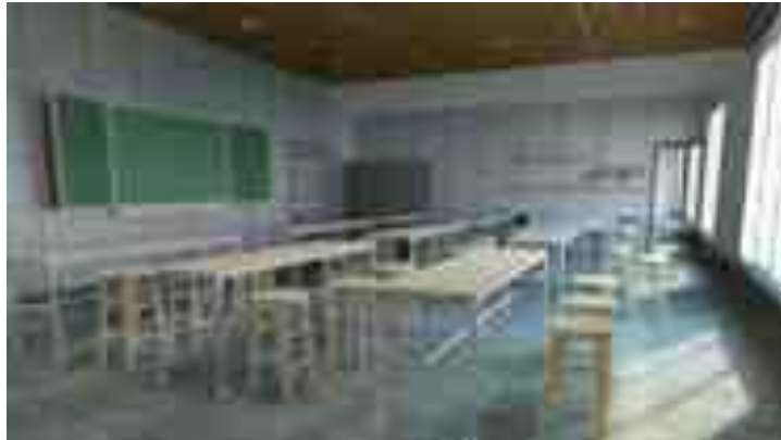
Gambar 7. Material pada Interior

Menggunakan material bekas bangunan lama dan/atau dari tempat lain serta menggunakan material ramah lingkungan.