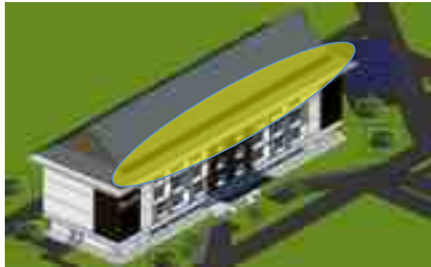
Gambar 5. Photovoltaic Science Learning Center

sehari maka photovoltaic yang dibutuhkan berjumlah enam puluh buah photovoltaic sebesar 200 wp.