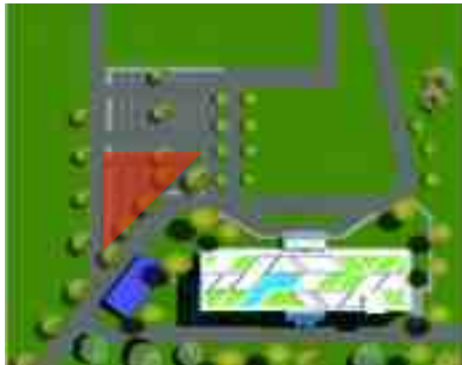
Gambar 1. Layout Science Learning Center

Dari analisis, didapatkan luas parkir sepeda sebesar 60 m 2 .