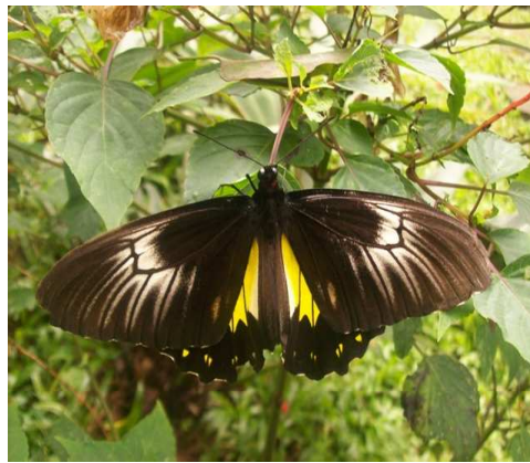
Gambar 3. Troides helena

memiliki dominansi 0,09. Hal ini menunjukkan persebaran jumlah jenis kupu-kupu superfamili Papilionoidae pada habitat ini merata dan mengindikasikan tidak ada dominansi suatu jenis terhadap jenis lainnya. Tumbuhan yang ada di sekitar DAS antara lain Impatiens , rumput, pisang, nangka dan durian. Sumber daya yang ada pada habitat ini mempengaruhi banyaknya jenis kupu-kupu yang ditemukan.