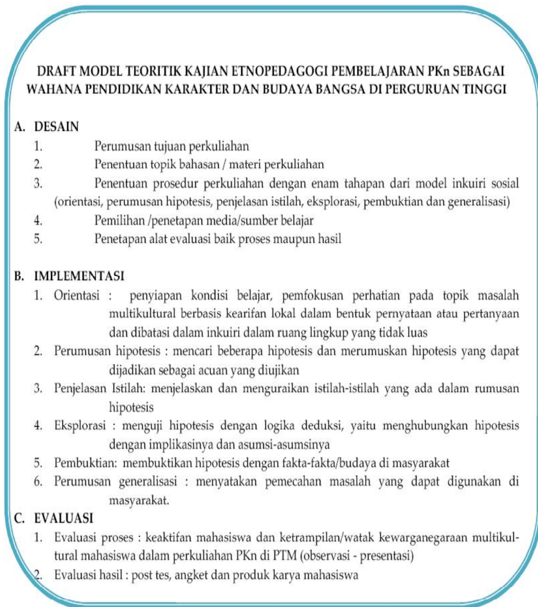
Gambar 3. Draft Kajian Etnopedagogi Pembelajaran PKn Sebagai Wahana Pendidikan Karakter dan Budaya Bangsa di Perguruan Tinggi Muhammadiyah Kota Malang

budaya bangsa secara rinci seperti yang dipaparkan pada gambar 3 berikut.