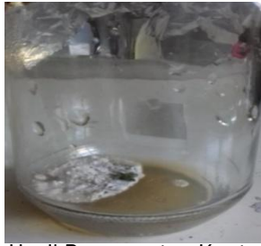
Gambar 1. Hasil Pengamatan Kontaminan pada Kelompok I.

Pengamatan yang dilakukan pada kontaminan kelompok II pada hari 1 dan hari ke 2 belum terkontaminasi pada masing-masing botol yaitu pada botol 1,2, dan 3, hari ke 3 pada botol 1 ada hifa pada media kultur berwarna putih, botol 2 terdapat bintik berwarna putih dan berhifa pada permukaan eksplan, botol 3 ada hifa berwarna putih pada media, hari ke 4 pada botol 1 hifa semakin banyak dan menutupi media kontaminan berwarna putih, botol 2 kontaminan berwarna putih menutupi media, botol ke 3 hifa semakin banyak dan kontaminan berwarna putih di permukaan media, hari ke 5 pada botol 1 hifa dan sporangiosfor nampak menonjol ke permukaan seperti jarum pentul dan mengandung sporangium dalam jumlah sedikit, botol 2 sporangiosfor nampak menonjol ke permukaan hifa dan spora masih sedikit, botol ke 3 hifa dan sporangium masih sedikit, hari ke 6 pada botol 1 hifa yang nampak seperti benang putih dan sporangium semakin banyak, botol 2 kontaminan berwarna putih dan menghasilkan spora, botol 3 hifa dan sporangium sudah mulai banyak menutupi kultur, hari ke 7 pada botol 1 kontaminan berwarna putih dan terdapat sporangium menutupi permukaan media, botol 2 kontaminan berwarna putih dan memenuhi semua permukaan kultur, botol 3 hifa seperti benang putih sudah banyak memenuhi botol.