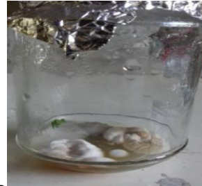
Gambar 2. Hasil pengamatan kontaminan pada Kelompok II.

Pengamatan pada kelompok II diambil salah satu kontaminan dari ke 3 botol dan dilakukan pengamatan pada mikroskop maka deskripsi yang ditunjukkan termasuk kelas Zigomycetes (Susilowati dan Listyawati, 2001) oleh karena warna sporangium berwarna putih, miselium terang dan berwarna, memproduksi spora, kemudian hifanya tidak bersekat/non septa, tangkai spora sederhana dan ada rhizoid. Dari pengamatan deskripsi pada kelompok II termasuk ciri deskripsi dari Mucor