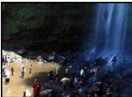
Gambar 3. Potensi Wana Wisata Cuban Rondo