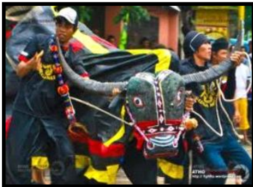
Gambar 4. Budaya dan kesenian masyarakat di Kabupaten Malang pada umumnya