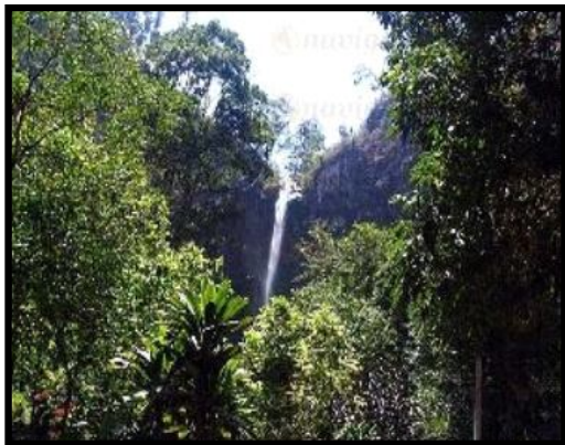
Gambar 2. Lanskap di wana wisata Cuban Rondo