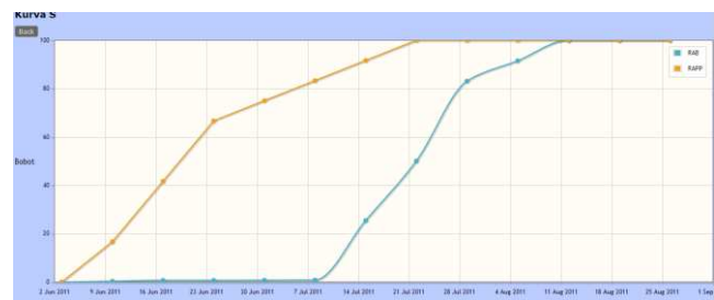
Gambar 9. Kurva S

Setelah project leader membuat rencana jadwal kerja, dan pelaksanaan jadwal kerja, maka project leader dapat membuat kurva S yang berguna untuk melihat kinerja dari suatu proyek dan dapat dilihat pada gambar 9.