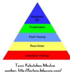
Gambar 1 Hierarki Kebutuhan Maslow

Salah satu teori motivasi yang terkenal adalah Hierarki Teori Kebutuhan Maslow ( Hierarchical of Needs Theory ) (Robbins & Judge, 2014).