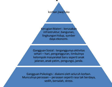
Gambar 3. Piramida Dampak Konflik Maluku

Serangkaian konflik yang terjadi di Maluku pada awal 1999 hingga 2002, dan dilanjutkan aksi kekerasan – kekerasan pasca perjanjian Mallino II yang dianggap sebagai perjanjian akhir perdamaian antara kedua belah pihak menyisakan banyak kisah – kisah miris.