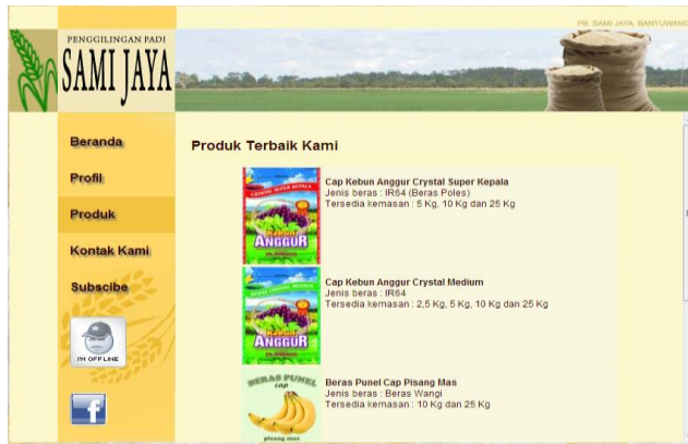
Gambar 2 Katalog Produk pada Halaman User