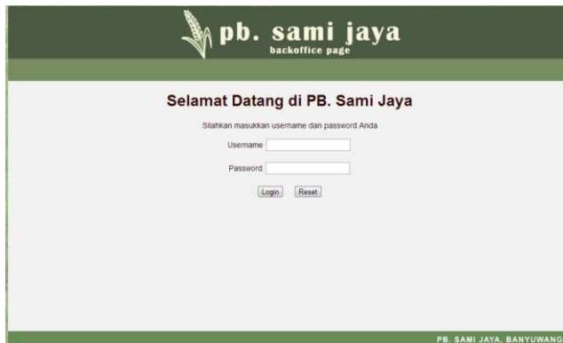
Gambar 3 Halaman Login