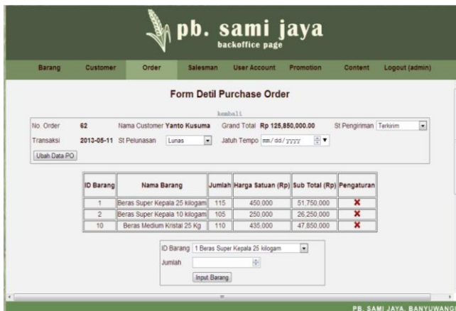
Gambar 4 Detil Purchase Order pada Halaman Admin