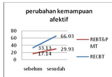
Gambar 4. Perubahan kemampuan afektif

Perubahan Afektif. Pada penelitian ini pemberian REBT dan PMT mampu meningkatkan kemampuan afektif dari 17,14 menjadi 29,93 sedangkan pemberian RECBT meningkatkan kemampuan afektif dari 33,13 menjadi 66,03 (lihat Gambar 4).