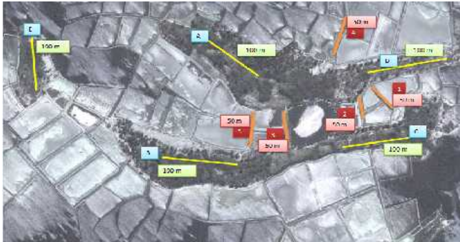
Gambar 3: Pembagian stasiun dan transek sampling mangrove asosiasi di Desa Balandatu

Pengambilan data pada daerah non tambak dilakukan menggunakan transek sepanjang 100 m dengan 5 plot berukuran 10 x 10 m pada beberapa titik di daerah yang masih ditumbuhi oleh mangrove asosiasi. Kemudian dalam plot 10 x 10 m dibentuk plot “ nested kuadrat ” untuk memudahkan perhitungan sampel mangrove asosiasi dengan beberapa kategori yaitu, herba, anakan, semak, perdu dan pohon. Sebagian besar kawasan yang dulunya menjadi habitat bagi mangrove asosiasi, kini telah berubah menjadi area tambak yang luas.