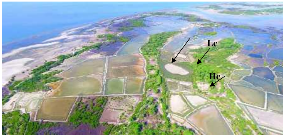
Gambar 4. Foto udara sebaran mangrove asosiasi di Desa Balandatu. S= Salicornia sp., Lc= Lansea coromandelica , Hc= Heteropogon contortus .

Pola penyebaran biji mangrove asosiasi juga berpengaruh terhadap pertumbuhan mangrove asosiasi secara mengelompok di daerah tersebut. Salah satunya dibantu oleh angin seperti Eupatorium odorata yang merupakan tumbuhan invasif dengan perkembangan sangat cepat dan membentuk komunitas yang rapat sehingga dapat menghalangi perkembangan tumbuhan lain. Hal ini menyebabkan Eupatorium odorata mampu mendominasi daerah tertentu di kawasan mangrove asosiasi dengan membentuk rumpun.