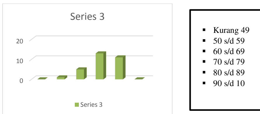
Grafik 2 Nilai Berbicara Siklus II

Dalam pelaksanaan tahap siklus II, telah terjadi peningkatan yang cukup signifikan dalam hal penekanan penggunaan lafal dan intonasi yang baik. Dalam pelaksanaan siklus II ini banyak siswa telah melakukan pertanyaan langsung kepada guru sehingga siswa lebih berani dan termotivasi. Lebih jelasnya dapat dibuat grafik sebagai berikut: