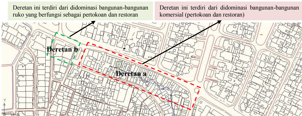
Gambar 1. Pembagian Deretan pada Sisi Kiri Jalan Kawi Atas

Berdasarkan lebar garis sempadan jalannya sisi ini terbagi menjadi 2 deretan. Deretan pertama dinotasikan dengan huruf a kecil (a) merupakan deretan bangunan yang tidak mempunyai garis sempadan jalan (GSJ=0). Deretan kedua dinotasikan dengan huruf b kecil (b) merupakan deretan bangunan yang mempunyai garis sempadan jalan sekitar 8 meter.