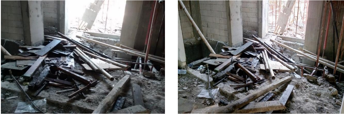
Gambar 3. Material Sisa Tercampur dengan Alat yang Masih Digunakan