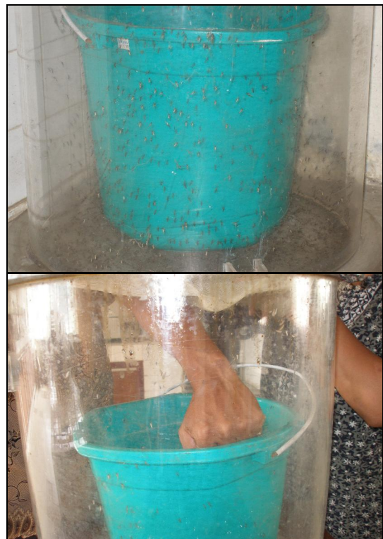
Gambar 3. Pengujian efektifitas terhadap gigitan nyamuk Aedes aegypti di laboratorium

Dari pengujian formula yang dibuat, krim rata-rata mempunyai pH normal yaitu berkisar 7 (Tabel 3). Dari uji kestabilan krim, diketahui bahwa semua jenis formula yang dibuat menunjukkan kestabilan yang bagus yang ditunjukkan dengan tidak adanya pemisahan minyak dari krim yang dibuat bahkan sampai