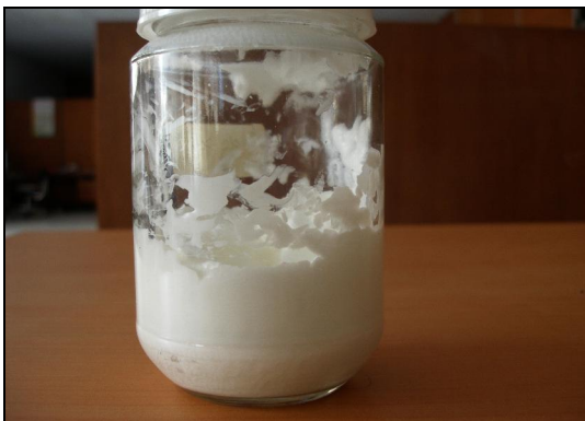
Gambar 2. Formula krim anti nyamuk dari fraksi minyak sereh

Dari penelitian pembuatan krim anti nyamuk dengan bahan aktif fraksi minyak sereh didapatkan krim anti nyamuk berwarna putih, bau khas fraksi sereh dan pH krim rata-rata pH normal yaitu berkisar 7 dan terasa hangat di kulit pada waktu dioleskan, dan bentuknya seperti terlihat pada Gambar 2.