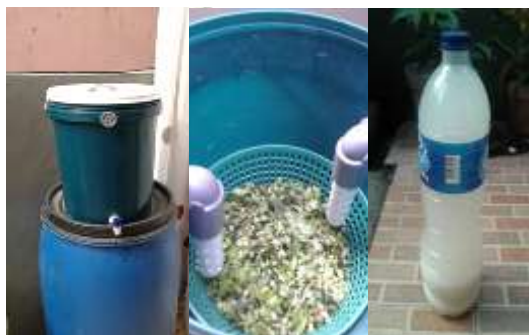
Gambar 2. Rangkaian Alat Fermentasi Sampah Organik Rumah Tangga