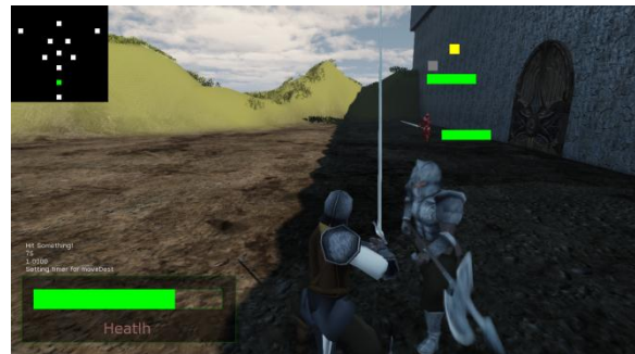
Gambar 9 Penguujian Enemy Event 2.

Keadaan satunya merupakan keadaan di mana terdapat enemy bertipe melee dan range dan yang bertipe melee berada di jalur serangan enemy bertipe range . Enemy bertipe range akan meminta enemy bertipe melee untuk bergeser. Dapat dilihat pada Gambar 10 dan 11.