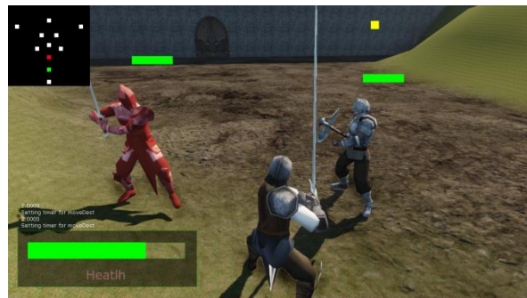
Gambar 4 Pengujian Exclusion Zone 2 .