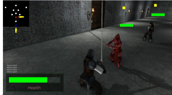
Gambar 2 Pengujian attack slot

Dalam game nantinya, pada saat enemy melihat player maka enemy tersebut akan mengambil sebuah slot dan mengejar player . Setelah mencapai jarak tertentu terhadap player , enemy akan berhenti mengejar dan berusaha mengelilingi player dengan mengambil jarak tertentu sesuai slot yang diambilnya. Pada Gambar 2 dapat dilihat dua enemy yang bertipe melee dan bertipe range di mana yang melee mengambil slot pertama dan yang range mengambil slot ketiga dan kotak indikator yang memiliki warna merah dan biru untuk menandakan bahwa slot tersebut telah terpakai. Enemy yang bertipe range mengambil jarak yang lebih jauh terhadap player karena slot miliknya merupakan slot ketiga