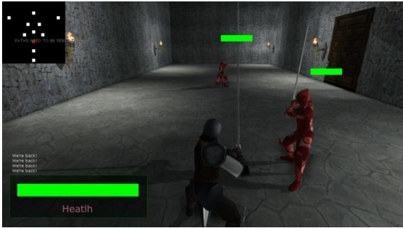
Gambar Error! No text of specified style in document. Penguujian Trigger System 1.