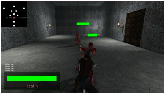
Gambar 6 Penguujian Trigger System 2.