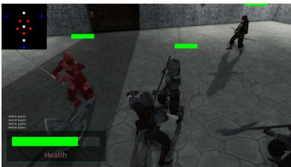
Gambar 13 Pengujian Player Mutex 2 .