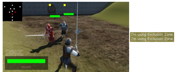
Gambar 3 Pengujian Exclusion Zone 1 .

Dalam usaha mengelilingi player , enemy bisa memiliki slot yang sama dan hanya memikirkan jarak terhadap player . Saat ada dua enemy atau lebih yang saling berdekatan dalam pengambilan jarak ini, maka enemy tersebut akan saling bergeser. Dapat dilihat pada Gambar 3 dan 4.