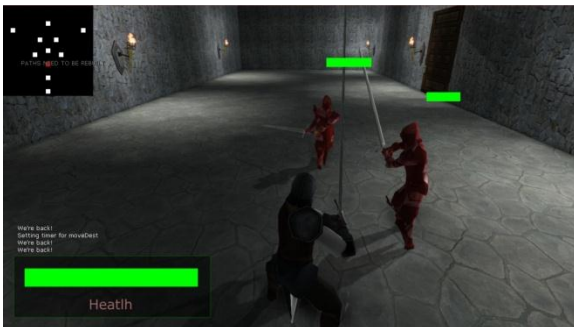
Gambar 7 Penguujian Trigger System 3.

Keadaan satunya merupakan keadaan di mana terdapat enemy bertipe melee dan range dan yang bertipe melee berada di jalur serangan enemy bertipe range . Enemy bertipe range akan meminta enemy bertipe melee untuk bergeser. Dapat dilihat pada Gambar 10 dan 11.