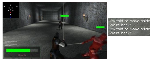
Gambar 11 Penguujian Enemy Event 4

Penguujian ini dilakukan dengan dua keadaan yang berbeda. Yang satu merupakan keadaan di mana hanya satu enemy yang melihat player dan meminta bantuan kepada enemy yang lain. Dapat dilihat pada Gambar 8 dan 9.