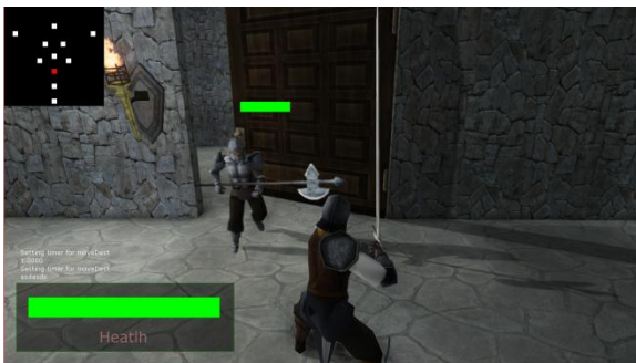
Gambar 14 Pengujian Allowed Zone 1 .

Pada saat player menghadapi enemy , enemy akan selalu berusaha mengejar player . Tetapi dengan menggunakan allowed zone , bila player memasuki sebuah ruangan yang bukan lorong maupun ruangan tempat pertama kali enemy tersebut muncul, maka enemy tersebut akan berhenti mengejar dan mengelilingi peta sekali lagi. Contoh kejadian ini dapat dilihat pada Gambar 14 dan 15.