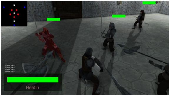
Gambar 12 Pengujian Player Mutex 1 .

Pada saat player dalam keadaan dikelilingi oleh banyak enemy , nantinya tidak semua enemy akan menyerang secara bersamaan. Enemy akan melihat apakah mutex masih tersedia atau sudah diambil oleh enemy lain. Enemy yang sudah mengambil mutex tersebut akan menyerang player sedangkan enemy yang tidak berhasil mengambilnya akan diam saja dan tetap dalam posisinya. Contoh kejadian ini dapat dilihat pada Gambar 12 dan 13.