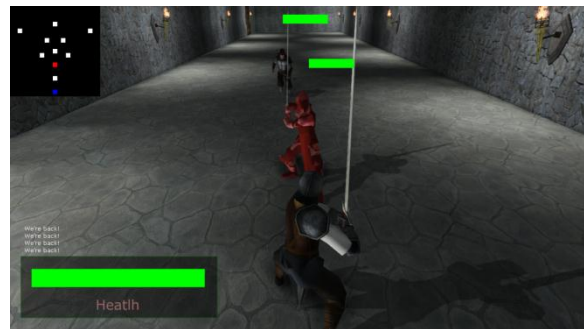
Gambar 10 Penguujian Enemy Event 3.