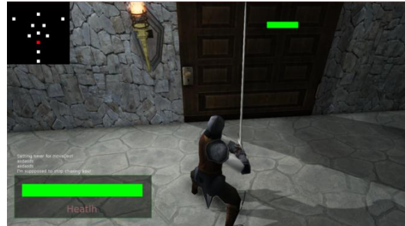
Gambar 15 Pengujian Allowed Zone