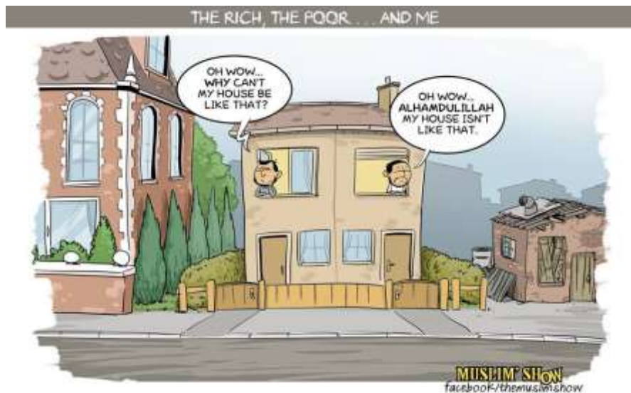
Gambar 1. “standpoint”