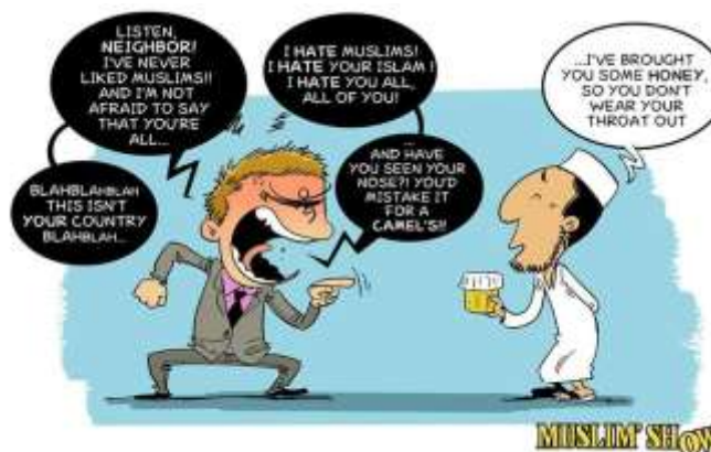
Gambar 2. "Salam"

Satu pria (kiri) merasa tidak nyaman atas pencapaian dan kondisi yang sudah didapatkan dalam bentuk rumah yang cukup. Sedangkan pria di sebelah kanan justru merasa bersyukur bahwa kondisi rumahnya jauh lebih beruntung dibandingkan dengan