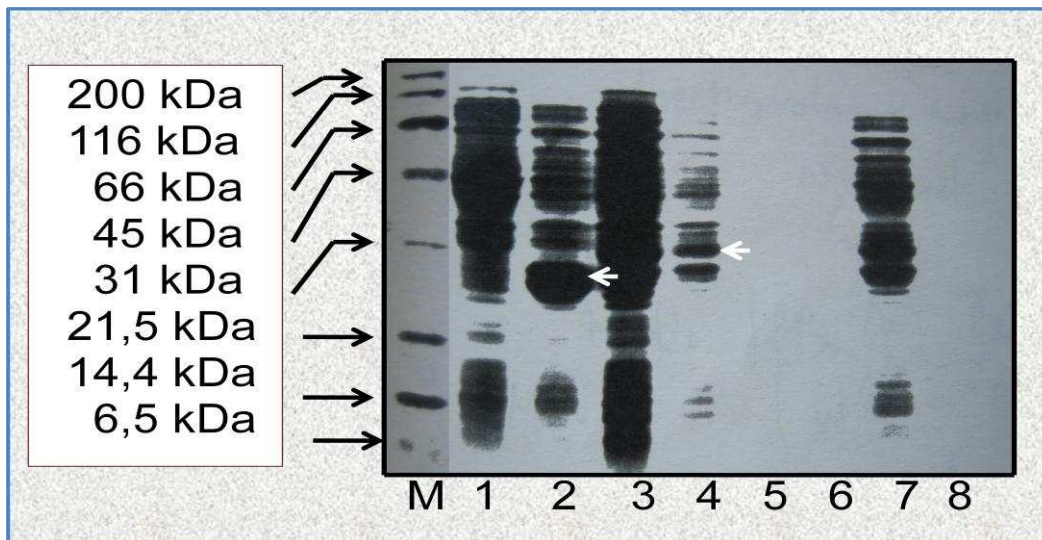
Gambar 1. Hasil ekspresi plasmid rekombinan. Kolom 1 = E.coli BL21 (tanpa membawa plasmid rekombinan), Kolom 2 = E.coli BL21 pembawa plasmid pGEX-4T-2, Kolom 3 = E. coli BL21 pembawa plasmid pGEX-HB100 terlarut, Kolom 4 = E. coli BL21 pembawa plasmid pGEX-HB100 terlarut dengan pengenceran 10x, Kolom 5 = E. coli BL21 pembawa plasmid pGEX-HB100 (pelet), Kolom 6 = E. coli BL21 pembawa plasmid pGEX-HB100 pellet dengan pengenceran 10x, Kolom 7 = E. coli DH5 \alpha pembawa plasmid pGEX-HB100 terlarut, Kolom 8 = E. coli DH5 \alpha pembawa plasmid pGEX-HB100 terlarut dengan 10 x pengenceran. M = Marker. Tanda panah pada Kolom nomor 2 menunjukkan enzim GST, sedangkan tanda panah pada Kolom nomor 4 menunjukkan protein fusi antara GST dan antigen Hepatitis B S100.

target menjadi indikator bahwa protein rekombinan tersebut berada dalam bentuk tak larut ( insoluble ).