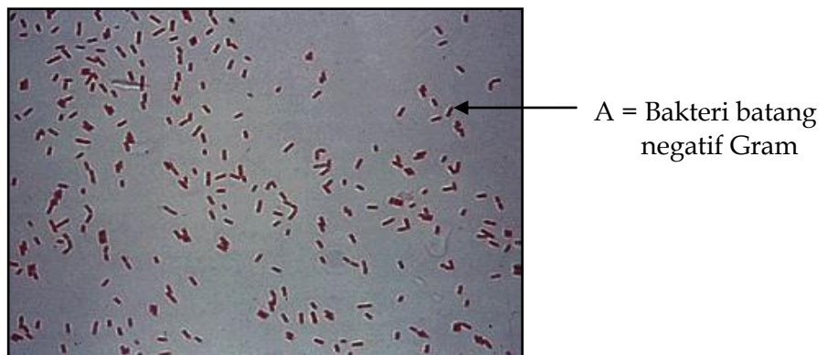
Gambar 2. Hasil Pewarnaan Bakteri negatif Gram Ket.: A = Bakteri batang negatif Gram